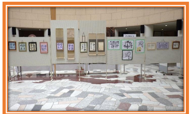
一年間の大作を展示しました