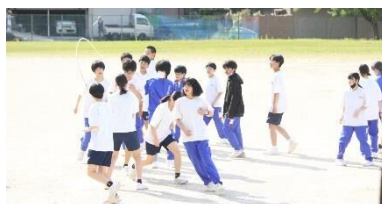
みんなで目標めざし、声をかけ合って。

体育祭当日は、生徒の皆さんの真剣な表情、そしてやり切った後の素敵な笑顔がたくさん見られることを、今からとても楽しみにしています。保護者の皆さん、地域の皆さんも、大きな声援をよろしくお願ひします。