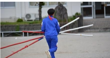
器具の運搬。自分の担った役割をやりきる。

この取組を通して、どのクラスも、互いの違いを認め合いながら支え合う「色とりどりのきれいな集団」に近づいていくことでしょう。そして、その集団の中で自分自身の頑張りを実感し、安心感や達成感を得られるのではないかと思います。