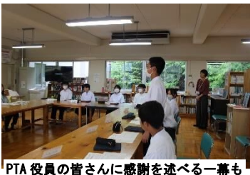
PTA 役員の皆さんに感謝を述べる一幕も

5月21日(木)、PTA本部役員の方々と生徒会役員の皆さんとで「語る会」を行いました。この会は、前期生徒会の活動内容とそれに取り組む思いについて、保護者の方々に知っていただくとともに、いただいた意見やアドバイスを生徒会活動の一層の充実に役立てることをねらいとしています。そのねらいのとおり、生徒会執行部・各委員長は、「こんな学校にしたい！」という願いと共に、具体的な活動について説明を熱心してくれました。「どうしたら合唱が高まるのか…」「生活習慣についての取組をどう進めたら…」など、自ら助言を求める姿、役員さんの「ペットボトルキャップの回収、広く周知するためには？」や「PTAとして何か手助けをしたいが、何か必要な物は？」などの質問にも臨機応変にはっきりと答える姿にリーダーとしての気概ややる気が感じられました。PTAと生徒会の連携を今後も大切にしていきたいと思います。