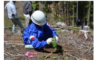
いつか、大きくなった木と出会いたい。