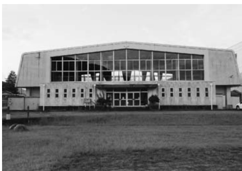
改修する旧大和第一北小学校体育館

べるスペース、乳幼児スペース、空調設備なども整備し、市内外の多くのみなさんに利用していただける施設を目指します。