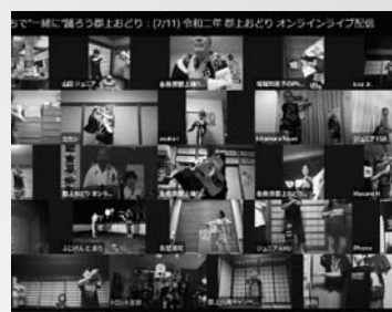
コロナの苦境を乗り越えた郡上おどり (オンラインライブ配信)