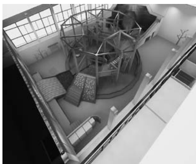
改修後のイメージ