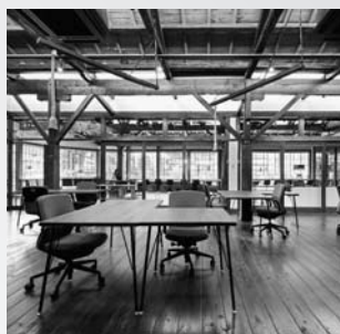
第1回で紹介した テレワーク拠点の誕生

これまでの8年間、郡上に期待を寄せて県外からサテライトオフィスを開設された団体・企業を中心に市民の活動を紹介することで、郡上が持つ魅力や可能性を再発見し、地域課題に対して新たな切り口で持続可能な社会の仕組み化を目指す姿に活力をいただけてきました。文化、教育、山や川などの自然、コミュニティ…。都市部では失われたものが、郡上では大切に守られ資