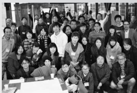
郡上資源の生かし方を 生み出したイベントの数々

源として存続しています。それを新たな手法で生かし、守り、次の世代へつないでいこうと奔走する熱い想いを持つ人たちがいることに、毎月コラムの編集をしながら感動しています。