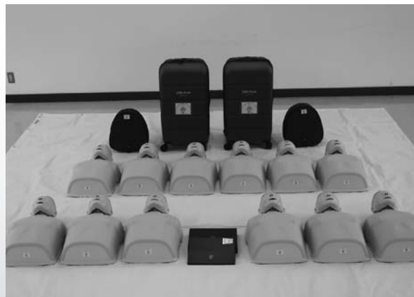
▲女性防火クラブ防火防災訓練用資器材