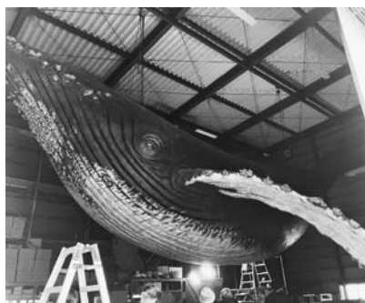
展示されるくじらの模型

岐阜県では、「ぎふ木育30年ビジョン」を核として、岐阜県の豊かな自然を背景とした『森と木からの学び』をぎふ木育として推進しています。その拠点施設となる郡上市のサテライト施設は、木のおもちゃや遊具などで木に触れ感ずること、木に「ふれあい、親しみ、関心を持つてもらふ」ことを目的とした施設です。