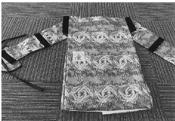
問 白鳥振興事務所振興課 82-3111

白鳥町の大島自治会が、活動備品として地域例祭で使用する獅子の力や、子役衣装の備品を整備しました。この事業は、住民が自主的に行うコミュニティ活動の促進を図り、地域の連帯感に基づく自治意識を盛り上げることを目指しています。