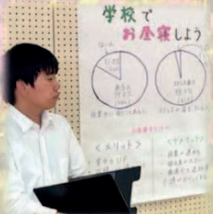
総合的な探究の時間の発表会

実践には地域との連携が欠かせません。郡上長良川ロータリークラブのみなさんと元祖踊りリーダー部