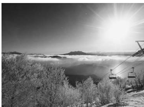
問 商工観光部観光課

このように、市内10か所のスキー場は地元の雇用創出のほか、観光交流人口の増加、観光消費の拡大を通じて、郡上市の地域経済を力強く支えています。観光庁の補助金活用による施設整備や、未来を担う子どもたちへの無料優待、さらには配当金による財政貢献など、その役割は多岐にわたります。今年も、多くの笑顔で賑わう冬の郡上を、スキー場群が彩ります。ぜひ、この冬は市内スキー場にお出かけいただき、進化を続けるスノーリゾート郡上の魅力を体感してください。