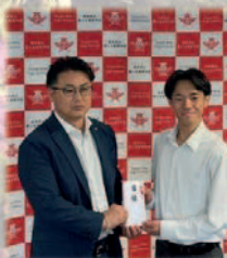
株式会社大西組様からの万博目録贈呈式