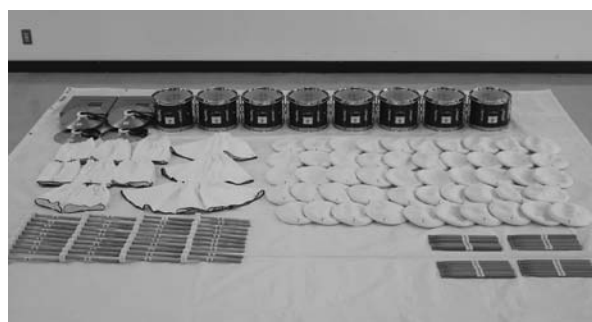
▲幼年消防用鼓笛隊活動資器材

幼年消防用鼓笛隊活動資器材（マーチングドラム等）を妙高こども園に、防火防災訓練用資器材（心肺蘇生訓練人形）を郡上市女性防火クラブに整備しました。この事業は、防火意識の向上と地域防災の担い手の育成を目的に行っています。