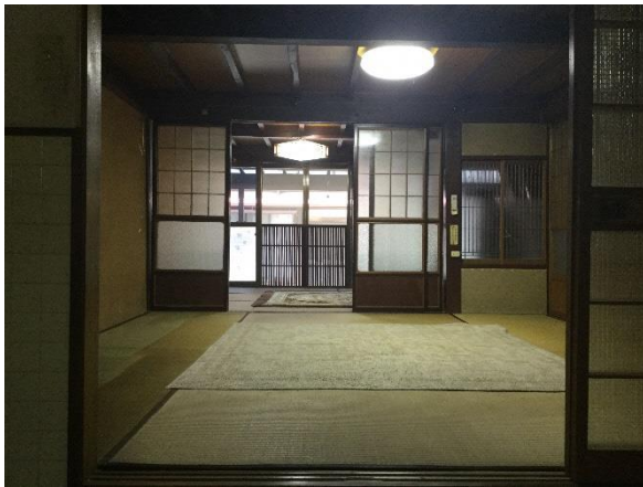
▼1階和室(台所側から)