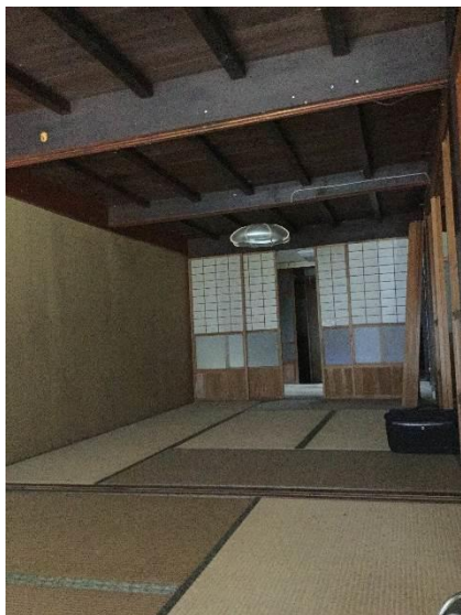
▼1階和室(土間側から)