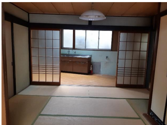
▼1F 和室からキッチン