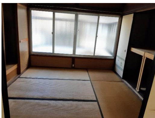
▼2F 和室 1