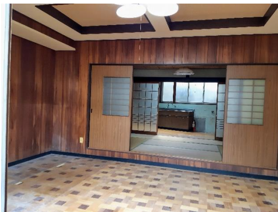
▼1F 洋室から和室、キッチン