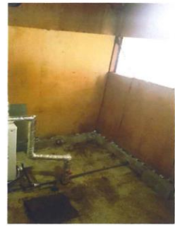
ボイラー室・納戸